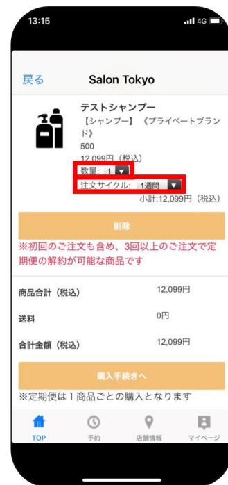
数量と注文サイクルを選択