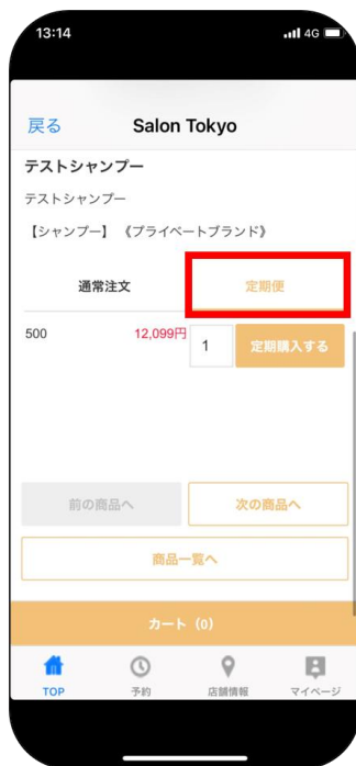
アプリ内での商品注文時に定期便を選択