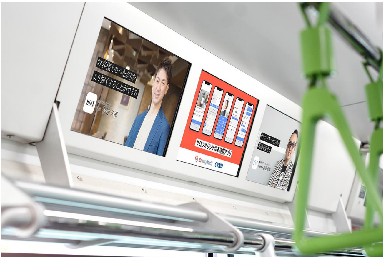
▲JR 山手線まで上チャンネル ※イメージ